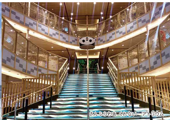
さんふらわあ くれない アトリウム