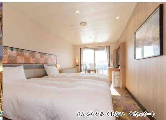
さんふらわあ くれない セミスイート